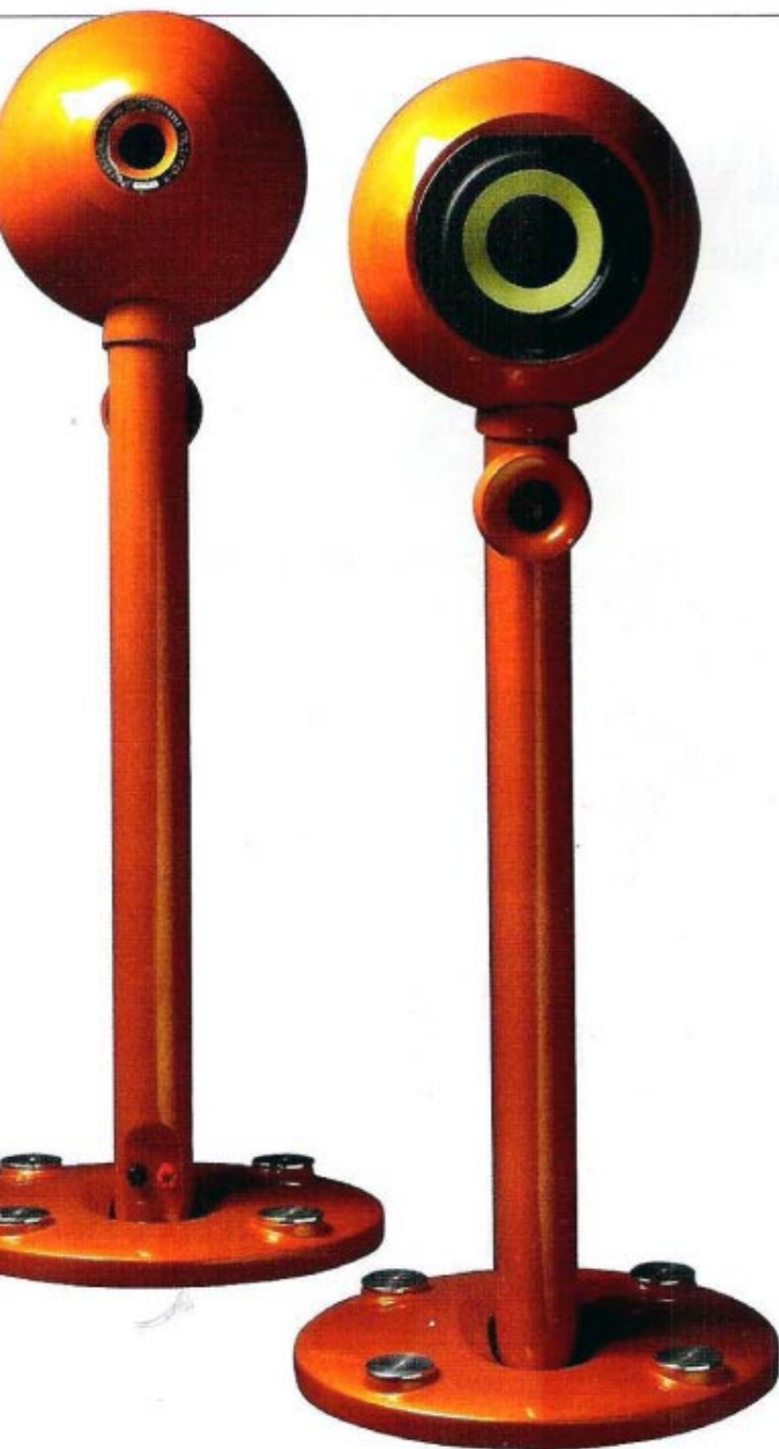
Pluto-F con gli stand che integrano il tweeter a cupola; notare la forma di questi diffusori, dettata prima di tutto da esigenze tecniche e poi di design. La finitura laccata, disponibile in una miriade di cromie, è molto piacevole al tatto.

efficace anche il posizionamento del tweeter, leggermente arretrato e quindi in fase temporale con l'emissione del midwoofer. Quest'ultimo è alloggiato in un contenitore in alluminio pressofuso (tutto il mobile è in alluminio), ottimizzato per essere esente dalla formazione di onde stazionarie all'interno del cabinet e modellato in modo da cancellare le emissioni posteriori, che si troverebbero altrimenti in controfase rispetto all'onda acustica principale. Le finiture sono di alto livello, come pure la verniciatura, laccata tattilmente molto piacevole. I Pluto F sono disponibili nei colori bianco, nero e rosso al prezzo "base", ma anche nei colori RAL Pantone automobilistici e motociclistici con un sovrapprezzo del 10%.